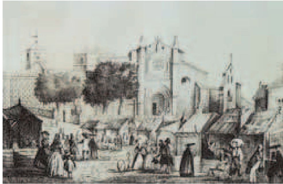
“San Pedro y la Feria”. Litografía de Francisco de Paula Van Halen. Año 1844.