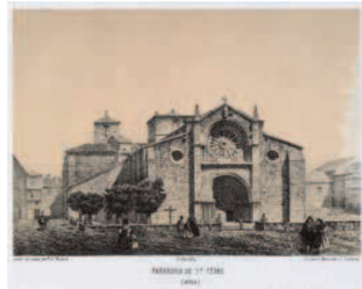
Puerta del Alcázar y San Pedro. Dibujos de Francisco Xavier Parcerisa. Año 1865.