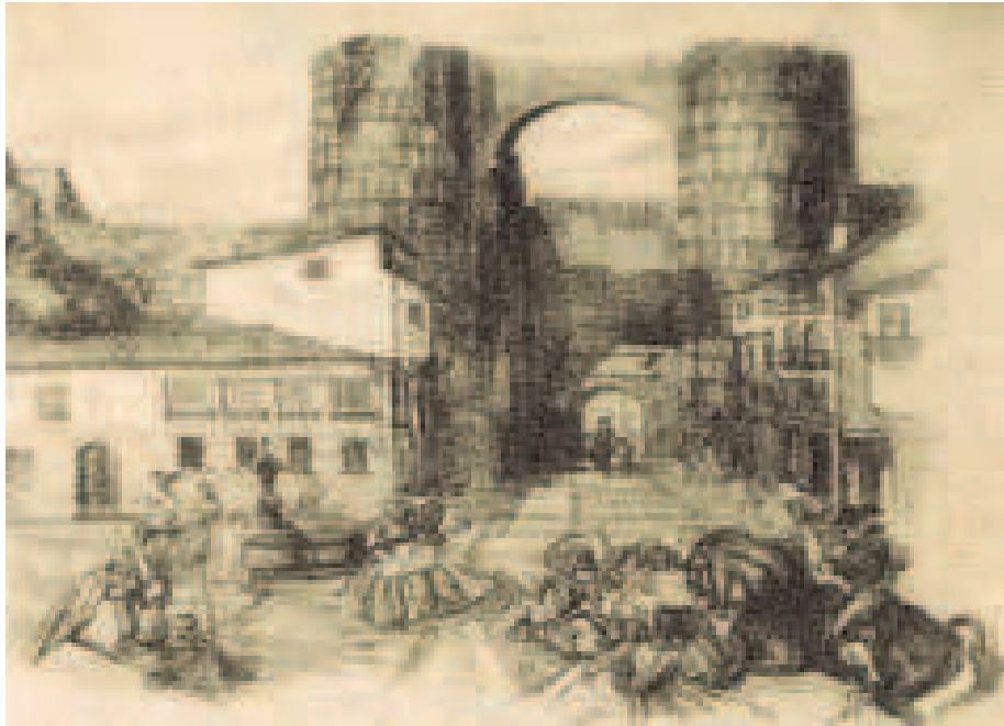
Escena típica. Aguatinta anónima. Hacia 1870.