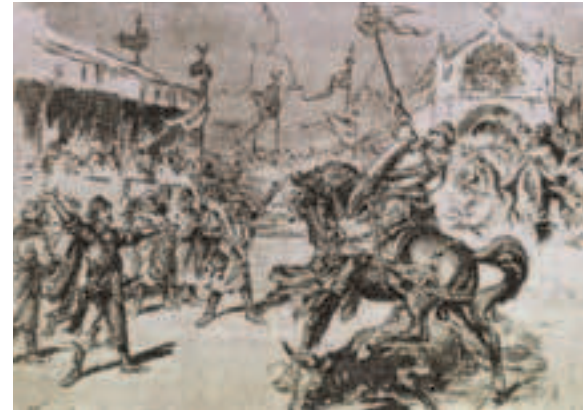
Triunfo del moro Zulema. Dibujo de Antonio Veredas. Hacia 1935.