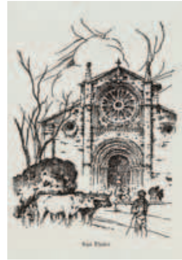
Dibujos de Antonio Veredas. Hacia 1935.