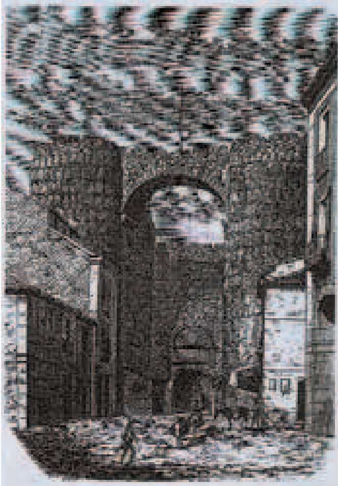
Arco del Alcázar. Revista El Museo Universal . Páramo/ Laporta. Año 1869.