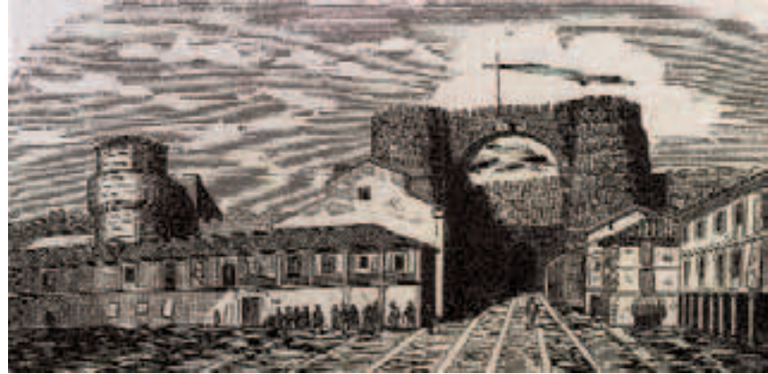
Puerta del Alcázar. Crónica General de Ávila . Joaquín Sierra. Año 1870.