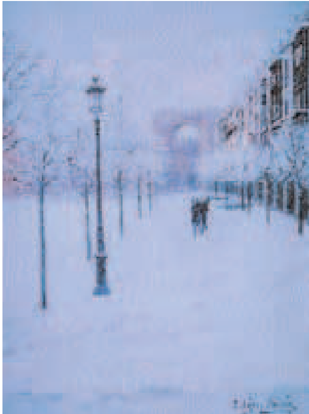
La gran nevada. Óleo de Eugenio López Berrón. Año 1998.