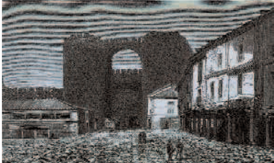
Puerta del Alcázar. Dibujo de Valeriano Foulquier. Año 1869.