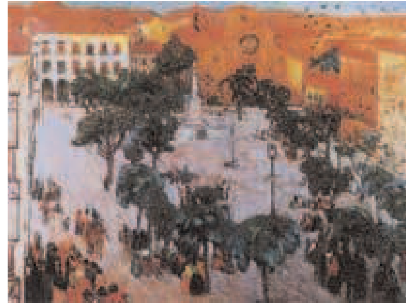
Día de mercado. Óleos de Guido Caprotti da Monza. Año 1919.