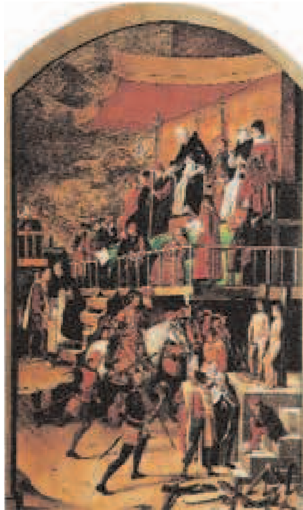
“Auto de Fe” celebrado en la plaza. Pintura de Pedro Berruguete. Año 1499-1503.