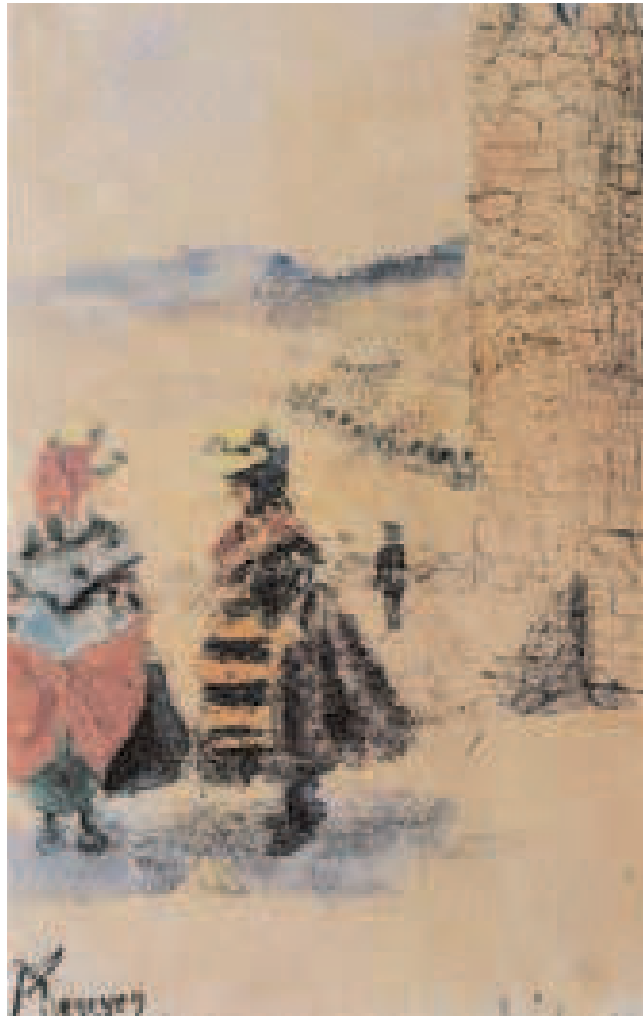
Mercado de Ávila. Acuarelas de Dario de Regoyos. Año 1888.