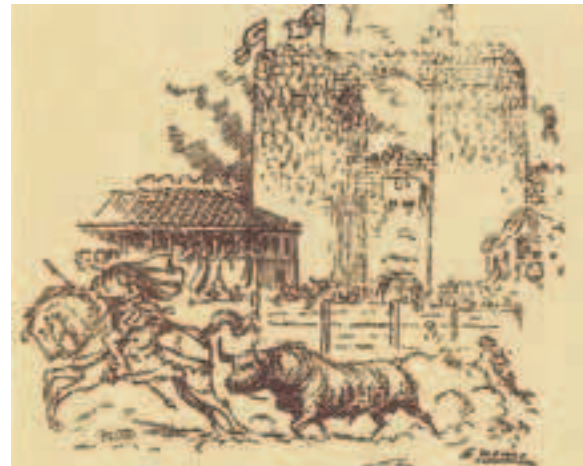
Correr los toros. Dibujo de Antonio Veredas. Hacia 1935.