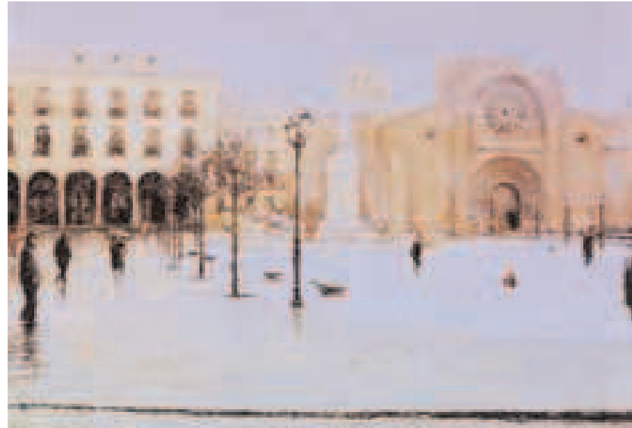
Vista parcial. Óleo de Fernando Sánchez. Año 1998.