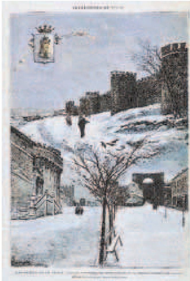
Las murallas de Ávila. Revista La Ilustración Española y Americana . Dibujo de Tomás Campuzano y grabado de Bernardo Rico. Año 1890.