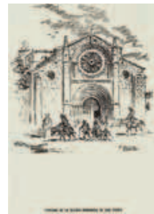
Dibujos de José Sánchez Merino. Hacia 1950.