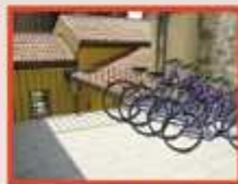
Centro de Recepción de Visitantes (Acceso Ronda de la Muralla)