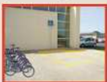
Polideportivo "El Seminario"

Media hora antes de la finalización del servicio ÁVILA TE PRESTA LA BICI , no se podrán retirar bicicletas de los puntos de préstamo.