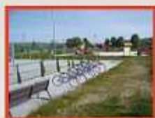
Área Recreativa del Río Chico